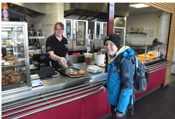
Mittagsbetrieb in der Mensa