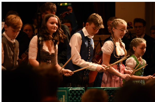
Sie haben den Rhythmus im Blut - unsere Percussiongruppe