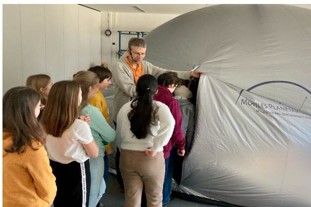
Das Mobile Planetarium entführt die Schüler in den Weltraum