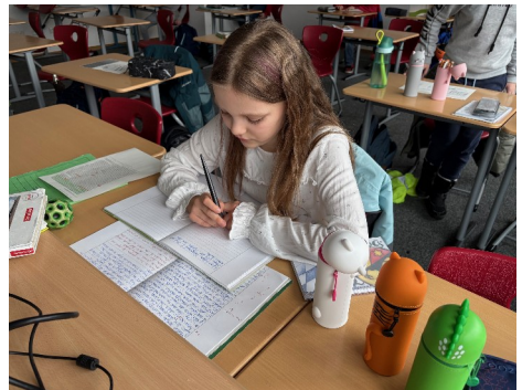
Studierzeit zur Erledigung der Hausaufgaben – anschließend gibt es viele Freizeitangebote

Die Gruppengröße schwankt je nach Wochentag zwischen 12 und 20. Jeder Assistent hat höchstens 7 Kinder zu betreuen. Zur Zeit besuchen 53 Schülerinnen und Schüler die Ganztagsschule.