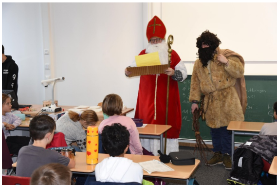
Der Nikolaus besucht die 5. Klassen – eine Aktion der Tutoren