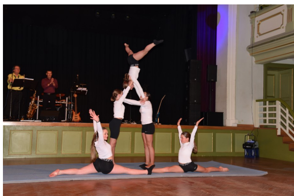
Akrobatik - vorgeführt auf unserem jährlichen Galaball