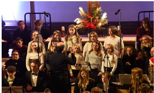
Der Unterstufenchor am Weihnachtskonzert des JBG in der Dreifaltigkeitskirche