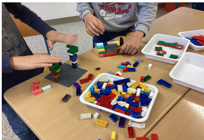
Altbekanntes Spielzeug eingesetzt zum kreativen Erarbeiten abstrakter Unterrichtsinhalte

Von der Unterstufe bis hinauf in die höheren Klassen erleben Schülerinnen und Schüler immer wieder unvergessliche Stunden, in denen das eigene Schaffen im Vordergrund steht.