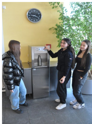
Wasserspender nicht nur in der Mensa

Das Kaufbeurer Trinkwasser bietet, dank seiner Qualität, eine ausgezeichnete Möglichkeit, den Flüssigkeitsbedarf zu decken. Von „still“ bis „sprudelnd“ kann dies an vier Wasserspendern im Schulhaus geschehen, die sich bei den Schülern großer Beliebtheit erfreuen – zumal auch der Schulranzen leichter bleibt, wenn man das Getränk nicht selbst mitbringen muss.