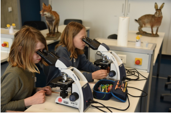
Knobeln, Forschen und Spaß beim Experimentieren am MINT-Tag