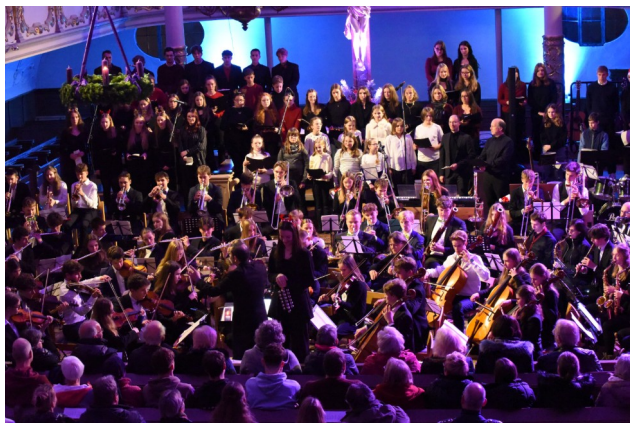
Chor und Orchester sorgen für unvergessliche Momente beim Weihnachtskonzert