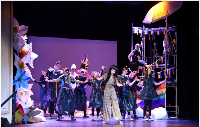
In der Theaterklasse anfangen und bald schon große Werke (hier „Was ihr wollt“ von Shakespeare) auf die Bühne des Stadttheaters bringen