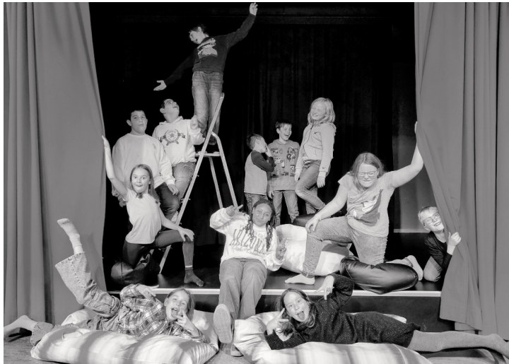
Viel Freude beim Experimentieren mit unterschiedlichen Charakteren

Unkostenbeitrag: 60 Euro pro Schuljahr. Sprechen Sie uns gern bei Schwierigkeiten mit der Finanzierung an.