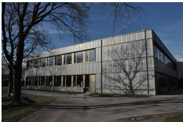
Das Technikum – unser modernes Naturwissenschaftsgebäude