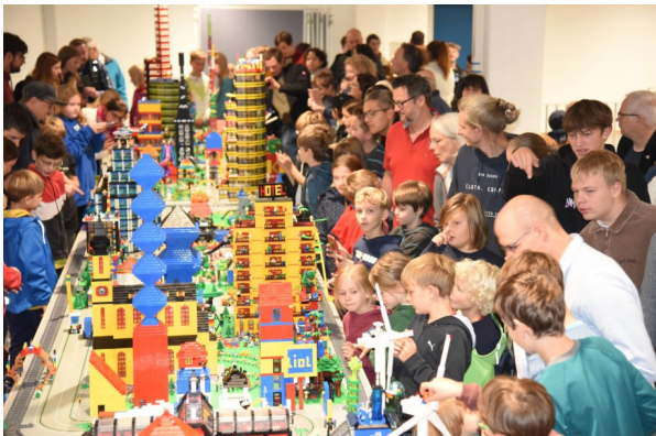
Am Wochenende zusammen eine riesige Legostadt bauen - einfach so!