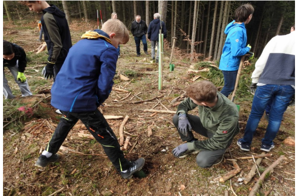
Bei der Waldpflanzaktion werden mehrere hundert Bäume gepflanzt – für unsere Zukunft