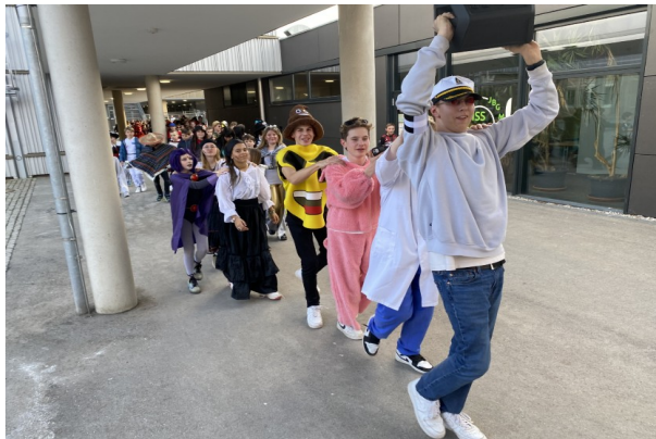
Eine große Polonaise durchs Schulhaus am Faschingsball der 5. Klassen – organisiert von den Tutoren