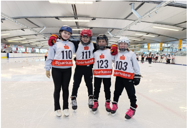
Unsere Eisschnelllaufmädchen beim Bayernentscheid