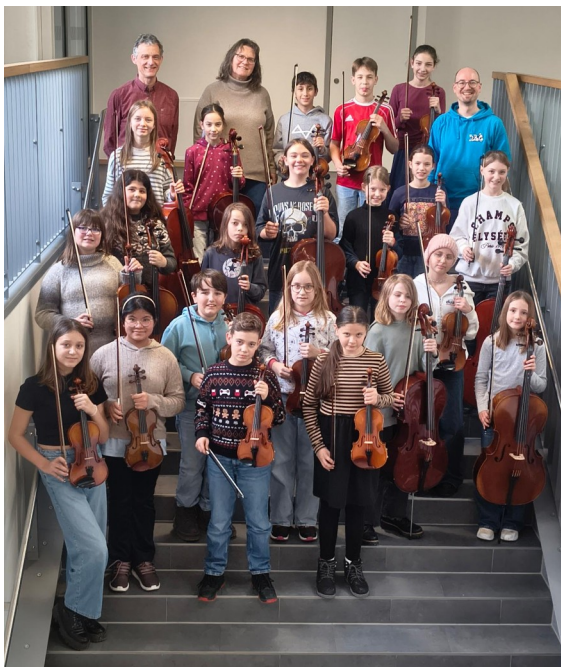
Unsere Streicherklasse 2025/26

Kosten: September bis Juli monatlich 15 Euro , mit eigenem Instrument 5 Euro . Sollte die Teilnahme eines Kindes nicht finanzierbar sein, wenden Sie sich bitte vertrauensvoll an uns.