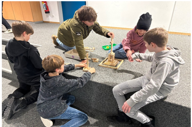
Die Architekten der Zukunft? Gemeinschaftsprojekte in der Offenen Ganztagschule