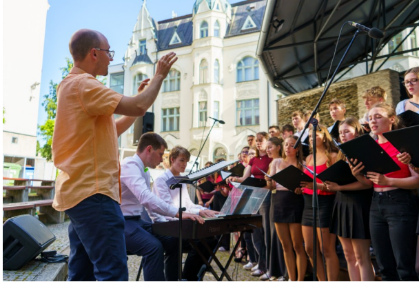
Ein Auftritt des Chors auf der Freilichtbühne bei unserer Konzertreise nach Jablonec