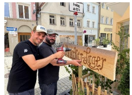
Ein starkes Team