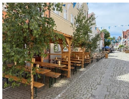
Ein gemütlicher Ort, um sich zu treffen