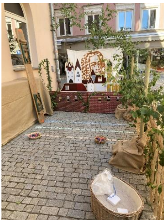
Spaß und Unterhaltung auch für unsere Kleinsten

Neben vielen kleineren Projekten liegt dabei heuer ein besonderer Fokus auf den neuen Biertischgarnituren für schulische Feste, einem neuen Flügel für die Musik und dem neuen Spiel- und Bewegungsbereich im Pausenhof.